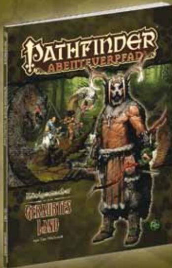
Teil 1: Geraubtes Land Art.-Nr. US53029 ISBN 978-3-86889-201-7