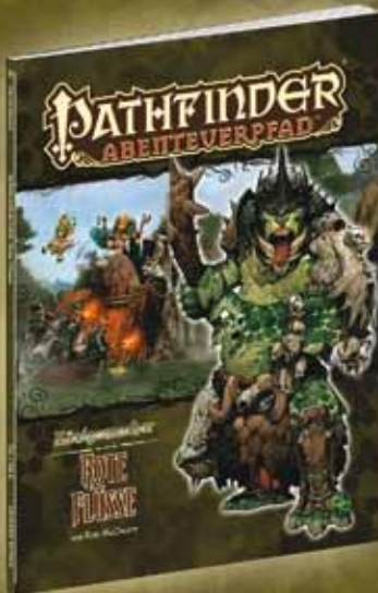
Teil 2: Rote Flüsse Art.-Nr. US53030 ISBN 978-3-86889-202-4