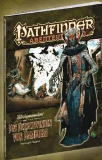
Teil 3: Das Verschwinden von Varnburg Art.-Nr. US53031 ISBN 978-3-86889-203-1